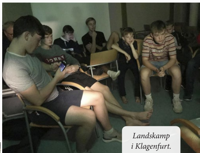
Landskamp i Klagenfurt.

Resten af dagen var drengene sammen med deres østrigske værtsfamilier og oplevede mange spændende ting.