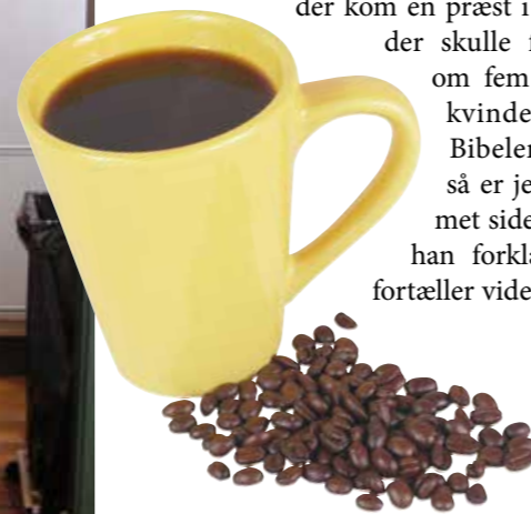
Aktivitet i køkkenet forud for kirkecaféen.

— ”Det startede med, at jeg hørte, at der kom en præst i caféen, der skulle fortælle om fem stærke kvinder fra Bibelen. Og så er jeg kommet siden”, som han forklarer og fortæller videre: