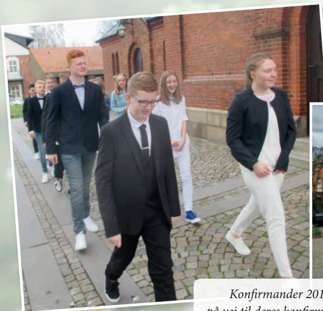
Konfirmander 2017 på vej til deres konfirmation.

PS: Dette gælder ikke konfirmander fra Midtjyllands Kristne Friskole, Børneskolen Bifrost og Parkskolen, der får information om indskrivning via skolen.