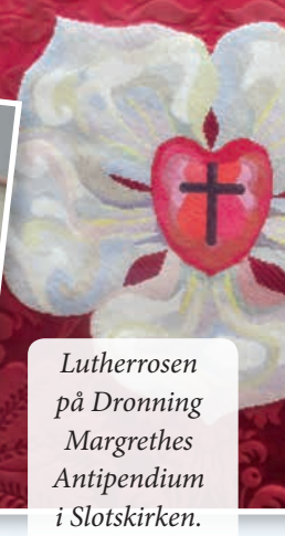
Lutherrosen på Dronning Margrethes Antependium i Slotskirken.