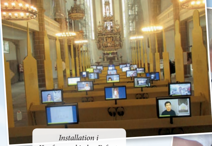
Installation i Kaufmannskirche, Erfurt.