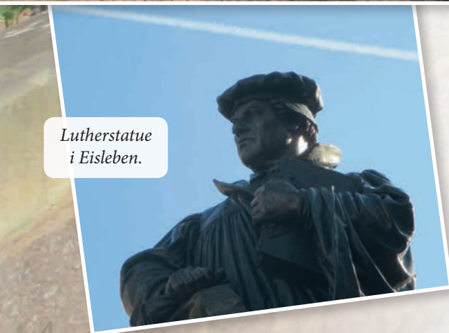
Lutherstatue i Eisleben.

Vi var også i Torgau , hvor Luthers hustru Katarina levede sine sidste år, efter hun blev alene.