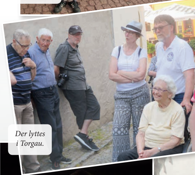
Der lyttes i Torgau.

Jeg håber, det er spørgsmål, som mange også her i Herning vil stille sig selv her i 500 året for reformationen. Og jeg håber, at svaret på spørgsmålet for mange vil være, at kristendommen er fundamentet for os. Og jeg håber, at vi vedkender os kirken som det fællesskab af mennesker, der har erfaret behovet for Guds kærlighed og tilgivelse – og er kaldede til at fortsætte reformationen – for hele tiden skal vi gentænke det, vi gør, hvorfor vi gør det og om det kunne gøres bedre.