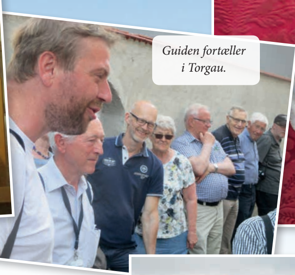
Guiden fortæller i Torgau.