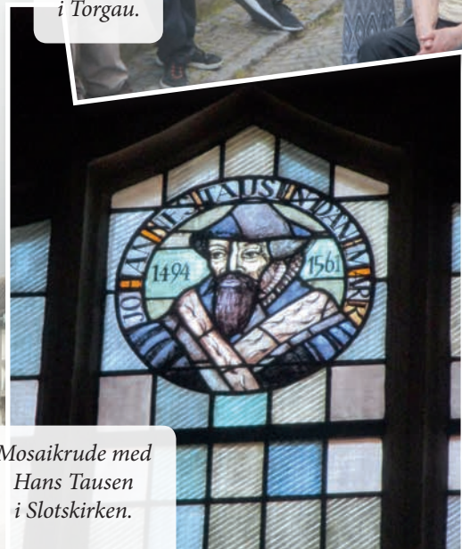
Mosaikrude med Hans Tausen i Slotskirken.

Tirsdag 31. oktober er der jubilæumsgudstjeneste i Viborg Domkirke.